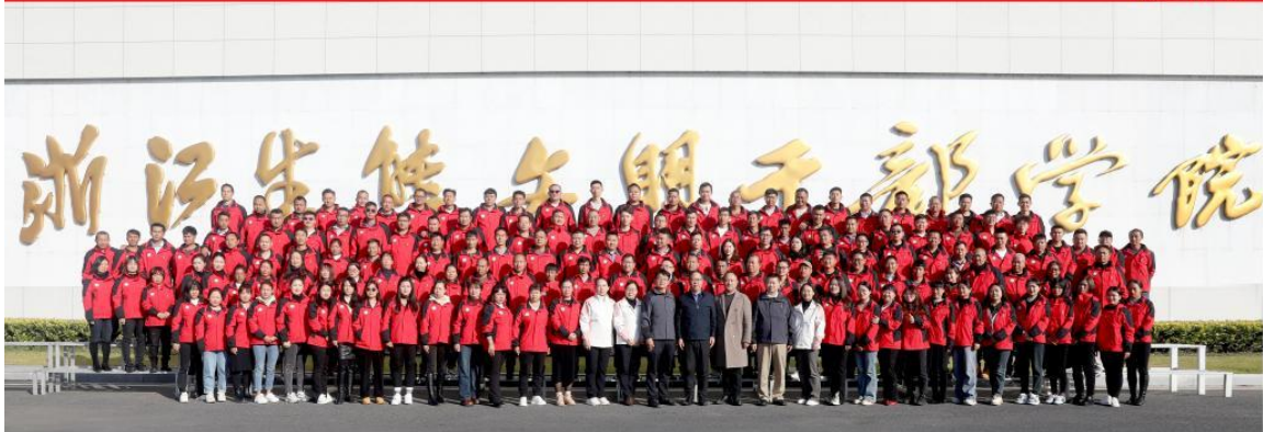
云南农业大学2023年云南乡村振兴带头人培育“头雁”项目学员浙江生态文明干部学院学习合影 2023. 11. 20

本段培训为期5天，主要学习习近平“两山”理念的形成、发展与践行，浙江“千万工程”和“美丽乡村”建设，如何发展壮大村级集体经济、深入实施乡村振兴战略，如何重塑新型城乡关系、促进城乡融合