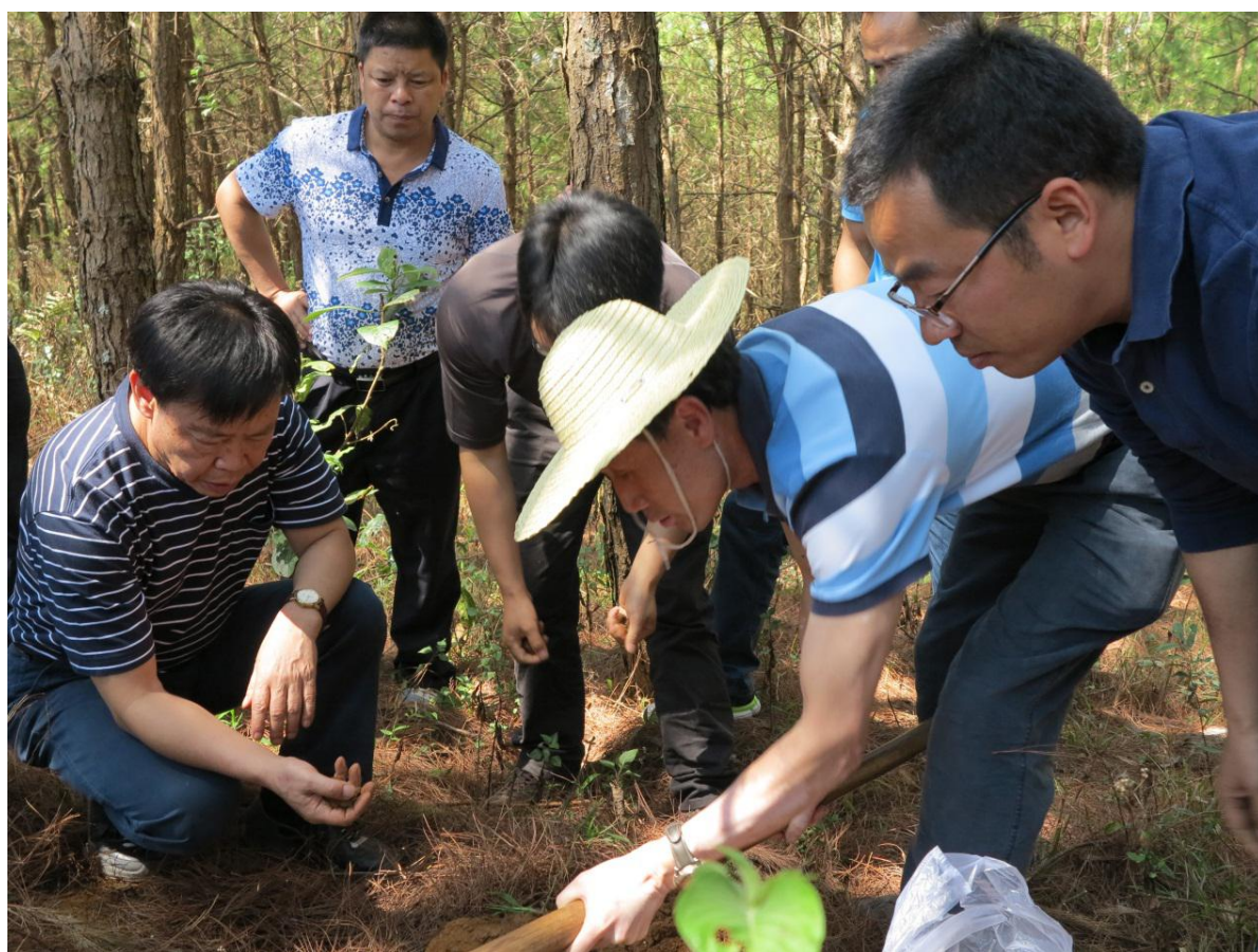
实地查看林下种植水土条件

县脱贫攻坚工作及农业产业发展情况。希望中国工程院整合各方优质资源，云南农大充分发挥人才教育、科技研发、资源丰富等优势，对澜沧县院士专家工作站、水利设施、异地搬迁规划、社会事业、光伏扶贫、电商扶贫等方面提供项目、人才和技术支持；通过院企、校企对接，加快科技成果转化，弥补澜沧县本土技术研发的不足；站在更高的视野，穿针引线，帮助引进一些有实力的合作伙伴和大型企业，为澜沧县经济社会发展注入活力；今后双方加强沟通联系，通过建立结对帮扶工作长效机制，促进双方的合作共赢。专家组成员结合实地调研情况，针对中药材种植及深加工、职业教育合作、蔬菜种植、林下种植、畜禽养殖等方面，聚焦项目扶持、技术服务、人才培养，提出了精准帮扶的各项具体措施。