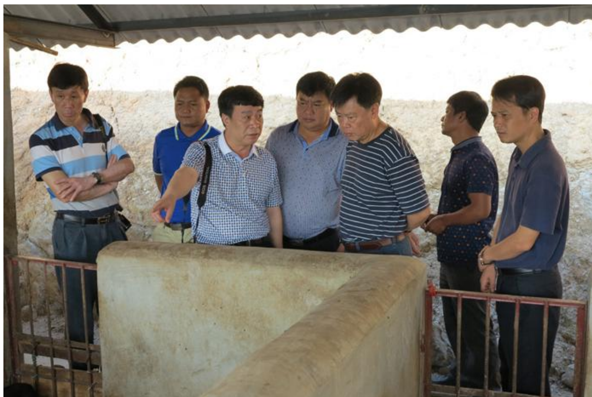
走进养殖圈舍调研生猪养殖基地

车间，与当地干部群众、企业基地负责人、技术人员深入交流，详细了解了农业生产水土条件、政策扶持、项目支撑、自主研发、经营管理等基本情况，仔细询问了当地产业发展、脱贫攻坚面临的主要问题困难，对现场能指导解决的具体问题，相关专家及时给予了细致的解答，对需要进一步研究协调的问题，专家组作了认真记录。