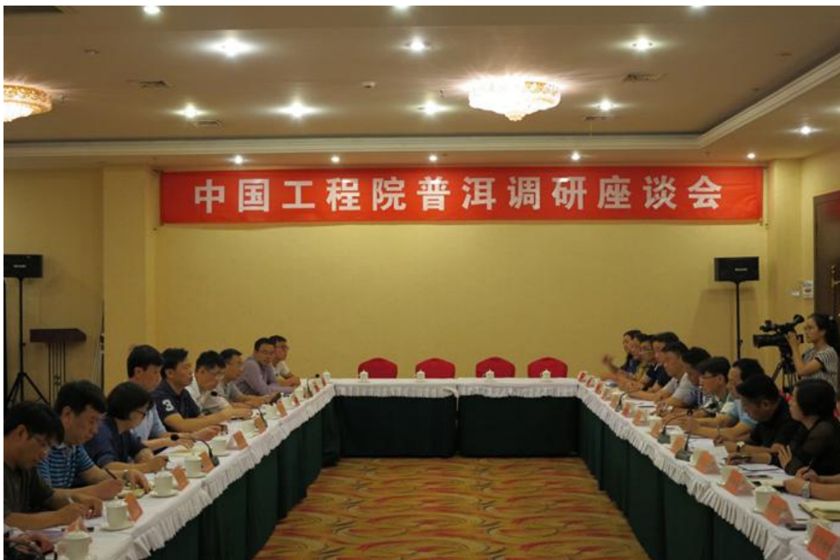
召开“普洱市食品安全现状及澜沧县扶贫工作”座谈会

5月8日，专家组抵达普洱市，与市委卫星书记、陆平副书记、市政府杨卫东副市长以及市农业局、林业局、畜牧局、扶贫办、科技局、科协、茶咖局、农科所、林科所、澜沧县政府等单位相关人员召开“普洱市食品安全现状及澜沧县扶贫工作”座谈会，对普洱市主要粮食作物、特色经济作物和畜禽养殖产品的生产现状、存在困难和发展措施进行了详细调研，专题研究了澜沧县的贫困现状、致贫原因和脱贫规划等扶贫问题。